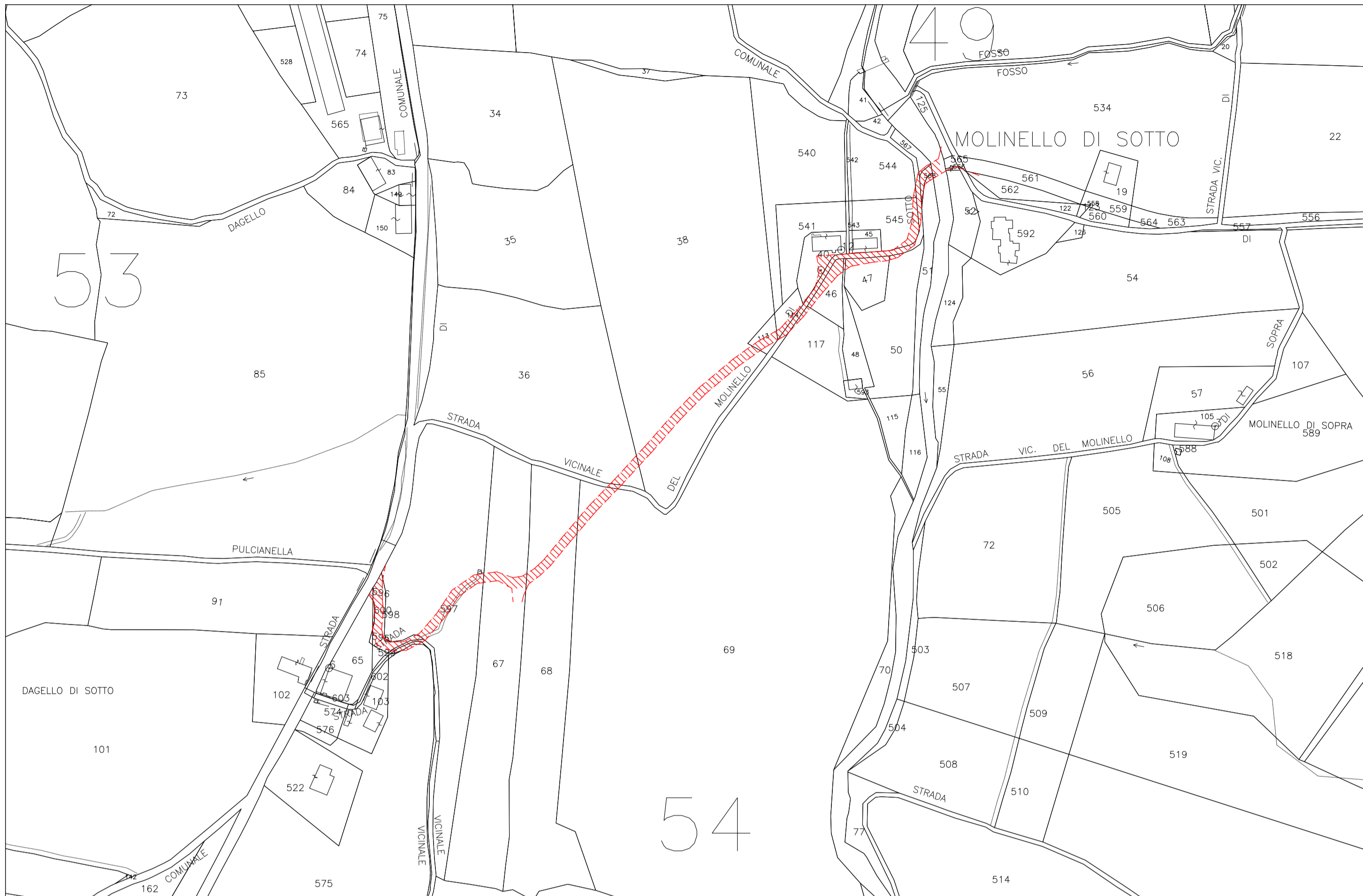
ESTRATTO CATASTALE - FG. 54 - scala 1:2.000